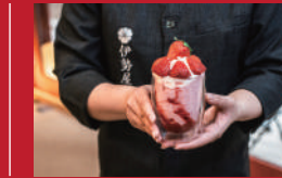
いちごヨーグルトフラッペ

小浜温泉ワイナリー | 1,540円 | ■雲仙市小浜町北本町862 ■電話番号:090-6964-5748