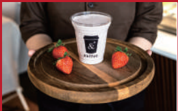
& Shake 苺

雲仙福田屋 | 宿泊者様の夕食デザートとして提供 | ■雲仙市小浜町雲仙380-2 ■電話番号:0957-73-2151