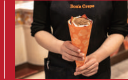
ストロベリーチョコ 生クリームアイスコー

ハイドレンジャ(ホテルニュー長崎内) | 550円 | ■長崎市大黒町14-5-1F ■電話番号:095-828-7226