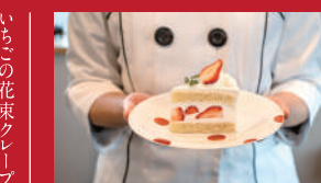
プレミアム生クリームと いちごのケーキ

古民家レストラン心笑 | 600円 ※要予約(2日前まで) | ■東彼杵郡川棚町上組郷1335 ■電話番号:0956-83-3456