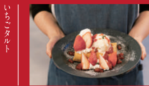
自家製ジャムのいちごシュー

橋屋本舗(お菓子のハシモトヤ パイビス店) | 480円 | ■諫早市鷺崎町308-5 ■電話番号:0957-21-3858