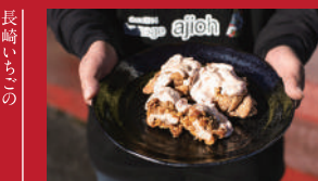
しょうゆからあげ イチゴソース添え

きりん食堂 | 880円 | ■諫早市八坂町7-17 ■電話番号:0957-22-4910