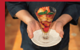
いちごしばいー かんざしー

酒×炬燵焼 三まいめ | 880円 | ■諫早市本町1-17 ■電話番号:0957-22-4393