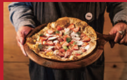
長崎県産さかのの 苺のピザ

Apartment. | 850円 | ■島原市中町806 ■電話番号:0957-64-3301