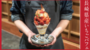
長崎県産いちごパフェ

みのりカフェ長崎駅前 | 1,969円 | ■長崎市尾上町1-67(長崎街道かもめ市場1F) ■電話番号:095-893-8222