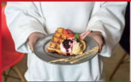
春いちごマッフル カタードフーズアイス添え

ラ・プリムール・ハマツ(ココウォーク内) | 950円 | ■長崎市茂里町1-55 2F ■電話番号:095-848-0009