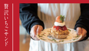
しあわせいちごのパイ

ベーグルまるこや | 480円 | ■大村市東大村1丁目2249-1 ■電話番号:0957-47-9553