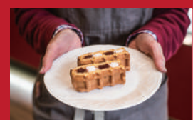
ボンパティのワッフル 雲仙いちご

ゴメンねエアポート | 540円 / 1カット※土日のみ(予約優先) | ■大村市協和町703-8 ■電話番号:0957-56-9546