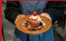
いちごのフォンダンショコラ 雲仙和紅茶付き

& coffee | 600円 | ■雲仙市千々石町丙2138-1 ■電話番号:0957-51-5000