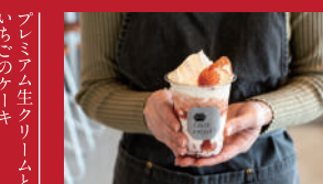
西海いちごのスムージー

かやのまる | テイクアウト 583円 / イートイン 594円 | ■東彼杵郡東彼杵町蔵本郷1754-1 ■電話番号:0957-46-3248