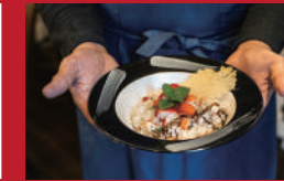
イチゴとシートのリンゼット

おやつ屋シュークル | 550円 | ■西彼杵郡津町左底郷88-5 ■電話番号:090-3016-1239