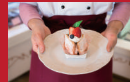
長崎いちごのカスタードパイ

Takagi | 1,300円 | ■島原市中町806 ■電話番号:0957-64-3301