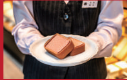
いちごカステラ巻

コーヒー&スイーツ「デイ・パート」(ヒルトン長崎内) | 850円 | ■長崎市尾上町4-2 ■電話番号:095-829-5488