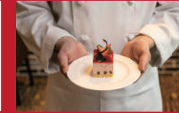
ムース・オ・フレーズ

バー「ムーンライト」(ホテルニュー長崎内) | 3,000円 ※ノンアルコールも可能 | ■長崎市大黒町14-5 ■電話番号:095-828-7319