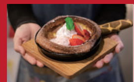
長崎いちごの ダッチペイビーケーキ

杉谷本舗 | 480円 | ■諫早市八坂町6-10 ■電話番号:0957-22-2306