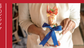
いちごの花束クレープ

陶農レストラン 清旬の郷 | 2,508円 | ■東彼杵郡波佐見町長野郷558-3 ■電話番号:0956-85-6288