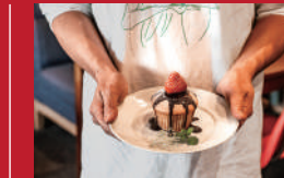
ハントーゴチソーライン

café mio | 500円 | ■島原市万町503-5 ■電話番号:0957-73-9030