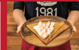
レナーズのいちごクレープ

いぶき地 本店 | 630円 | ■諫早市八天町3-10 ■電話番号:0957-21-5050