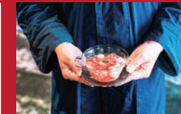
ミニオリジナルかんざし

イロドリココロ | 3,200円 | ■南島原市深江町丁4621-1 風びより内 ■電話番号:090-8804-1655