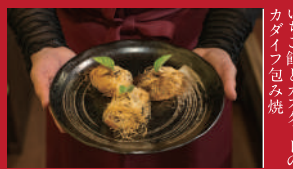
いちご餡とカスタードの カダイフ包み焼

中華ダイニング 杏てい | 650円 / 2個 | ■諫早市泉町25-32 ■電話番号:0957-21-8155