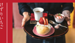
いちごあんバターサンド 食べたらいちご天福♡

創作厨房たこまる | 600円 | ■諫早市多良見町木床106のぞみ公園など市内3ヶ所 ■電話番号:0957-49-2731