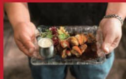
イチゴと鶏の洋風チキナン

cafe topor store(カフェトポールストア) | 800円 | ■諫早市高城町 8-17 ■電話番号:050-1308-6489