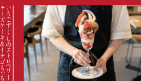
ゆめのかいちごパフェ

Bakery Shop Fleur | 1,900円 / 2,400円 ※単品購入可 | ■大村市森園町663-3 サンスバおむら施設内 ■電話番号:0957-40-0244