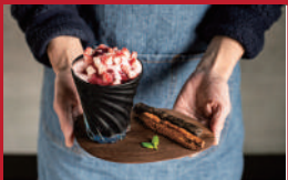
長崎県産さかのの チョコレートのがりがり

MARUZENカフェ | 1,100円 | ■島原市有明町大三東丙268-1 ■電話番号:0957-61-1535