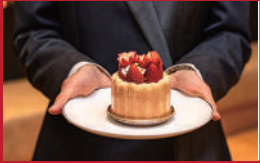
シャルロット・フレーズ

みのりカフェ長崎駅前 | 1,969円 | ■長崎市尾上町1-67(長崎街道かもめ市場1F) ■電話番号:095-893-8222