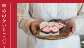
贅沢いちごサンド

カジュアルレストランOLIMAMA | 1,408円 | ■大村市東本町481 ミライ図書館1F ■電話番号:0957-46-3910