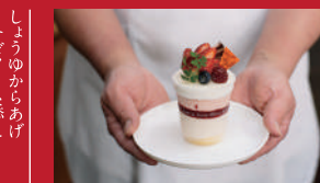
紅茶とイチゴのムース

からあげ味王 | 600円 / ソースは別添 | ■諫早市幸町37-3 ■電話番号:0957-21-0124