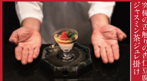
究極の手触りの杏仁豆腐 ジャズミン茶シロ掛け

海を見渡す個室露天の宿 伊勢屋 | 880円 | ■雲仙市小浜町北本町905 ■電話番号:0957-74-2121