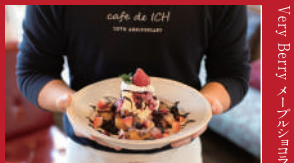
Very Berry マンママン

集い居酒屋零~ZERO~ | 900円 | ■諫早市高城町7-17 ISMビル2F ■電話番号:0957-40-0199