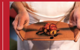
モックラレーズの串揚げ 苺とハムサミコーリス

ハンバーガー&クレープショップ トミーズ | 530円 | ■諫早市本町1-12 ■電話番号:0957-23-3843