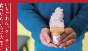
母さん牛の ジェラートいちご

和カフェ 和らびの | 680円 | ■諫早市目代町1485 ■電話番号:0957-47-6200