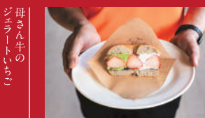
ハーブベーク いちごサンド

長崎ジャージーファーム | 450円 | ■諫早市長田町1147-3 ■電話番号:0957-24-8187