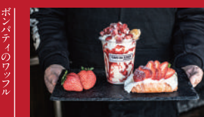
いちごやわらかのストロベリー チーズケーキ&イチゴもち

BonPatty | 162円 / 個 ※全店販売 | ■大村市幸町25 イオン大村施設内 他 全店 ■電話番号:0957-52-1789