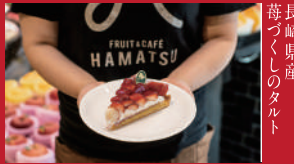
長崎県産 苺づくしのタルト

ボンズクレープ(ココウォーク内) | 740円 | ■長崎市茂里町1-55 3Fフードコート ■電話番号:0958-01-6101