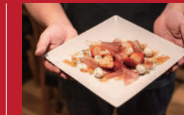
苺と生ハムのカブレゼ

洋菓子ル・ミエル | 630円 | ■諫早市城見町7-19 他 ■電話番号:0957-22-0088