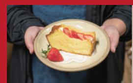
シフォンのいちごサンド

一葉団樂 | 400円 | ■諫早市幸町311-4 他 ■電話番号:0957-21-6500