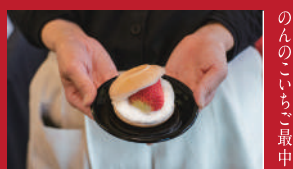
のんのいちご最中

つづみ団子 | 360円 | ■諫早市多良見町化屋789-25 ■電話番号:0957-43-0887